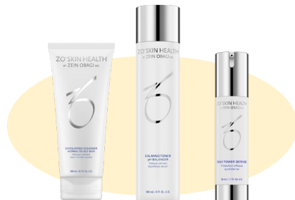
基本セット (洗顔、化粧水、日中美容液) ※トライアルセット その他商品もあります