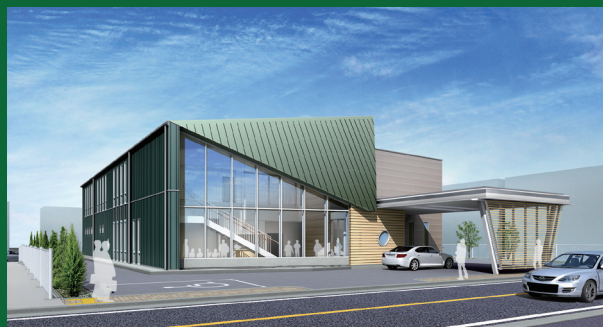
霞ヶ関在宅リハビリテーションセンター外観