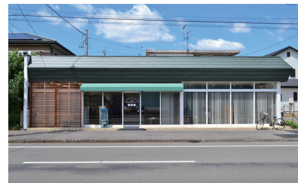
地域包括支援センターかすみ外観

暮らしやすい地域づくりに取り組んでいます。高齢者の心身の状態に合わせた適切なサービスが提供されるよう、地域のケアマネジャーと一緒に支援をします。また、地域の皆さんと一緒に暮らしやすい地域にするために、関係機関と連携し、ネットワーク作りに力を入れています。