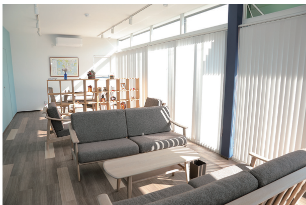
地域包括支援センターかすみ内観

いつまでも元気で介護が必要な状態にならないよう、健康づくり、介護予防を支援します。「ときも運動教室」など、市が実施する介護予防事業の案内、利用支援を行い、いつまでも元気に生活する支援をします。また、介護予防ケアプランを作成し、介護予防サービスなどを受けられるように事業者等との調整をおこないます。