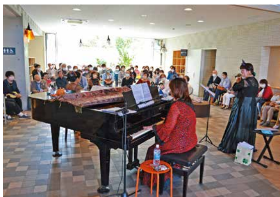
地元のピアノ教室の発表会や余興でもご利用いただきました

またパサージュ (1階フロア) を利用して日頃の活動の成果を披露したいという方への貸し出しも行っており、演奏だけでなくダンスや手品、演劇など、ジャンルを問わずご活用いただけます。