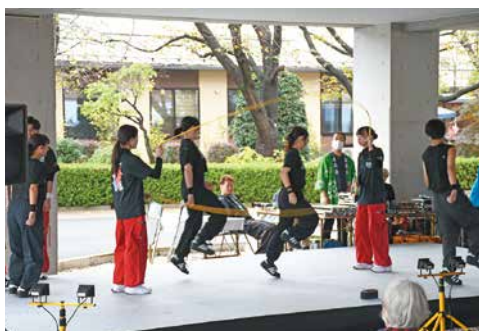
ダブルダッチ パフォーマンス