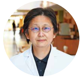
医療法人真正会 霞ヶ関南病院 耳鼻科医師 補聴器相談医