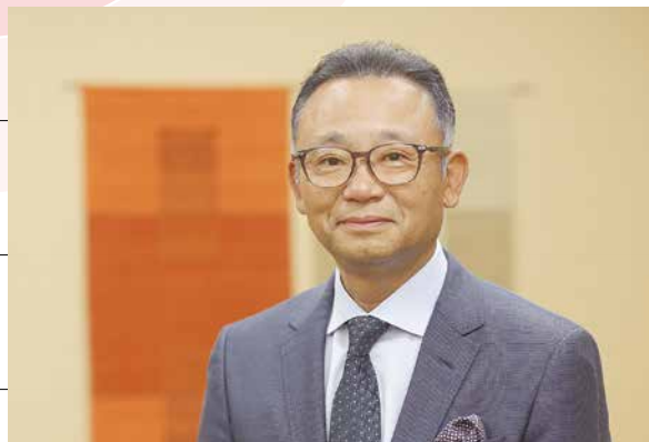
かすみケアグループ 社会福祉法人真正会 理事長 医療法人真正会 理事長 一般社団法人Hauskaa 代表