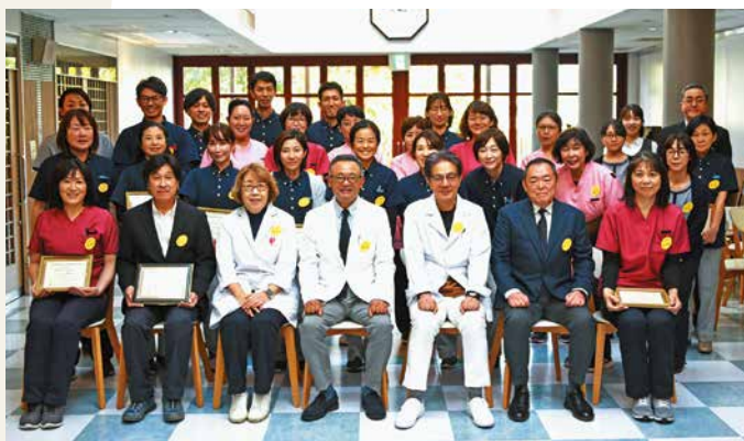
永年勤続表彰を受けた職員(医療法人真正会)

永年勤続者には賞与とともに「ゆめ休暇」という長期のリフレッシュ休暇が贈られます。社会人になると長期の休暇取得は難しい現実がありますが、このような休暇制度も職員のモチベーション維持につながっています。