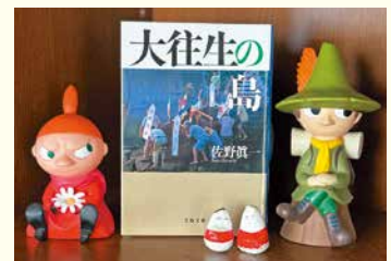
佐野眞一「大往生の島」文春文庫、2009

現在、「地域づくり」が重要視されていますが、周防大島の住民の皆さんから学ぶところが多いうように思います。