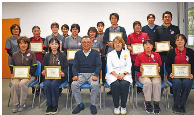
永年勤続表彰を受けた職員(社会福祉法人真正会)